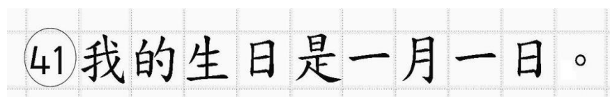
Рис.18. Образец написания иероглифических знаков

Бланк ответов № 2 (лист 1 и лист 2) по китайскому языку (рис. 16 и рис. 17) предназначен для записи ответов на задания с развернутым ответом по китайскому языку ( строго в соответствии с требованиями инструкции к КИМ ЕГЭ и к отдельным заданиям КИМ ЕГЭ ). Каждый иероглифический знак и каждый знак препинания следует писать внутри отдельной клетки в поле ответов бланка ответов № 2 (дополнительного бланка ответов № 2) (рис. 18).